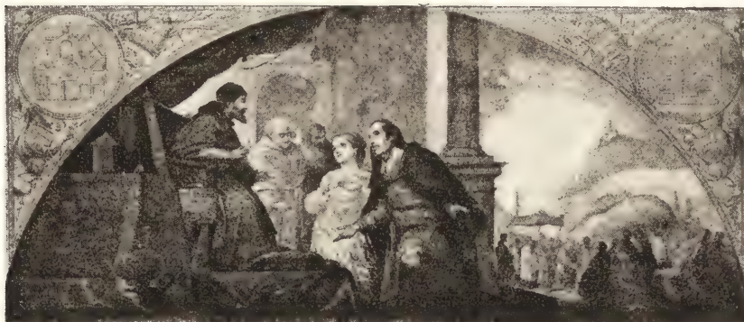
LA RÉVÉLATION DU SONGE DU PATRICIEN.